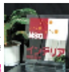
詳しくはこちら [Dシリーズページ]

◆特長 板ガラスの透明なキャンパスに、NSGインテリアの持つ優れた加工技術を駆使して思うがままに描き出されるのが「インテリア・ドリーム」のDシリーズです。他社の追随を許さない、NSGインテリアのカラー・鏡・タペを一枚のガラスに凝縮できる加工技術が可能にする、豊かな表現力を持つインテリア装飾材料を是非お役立て下さい。